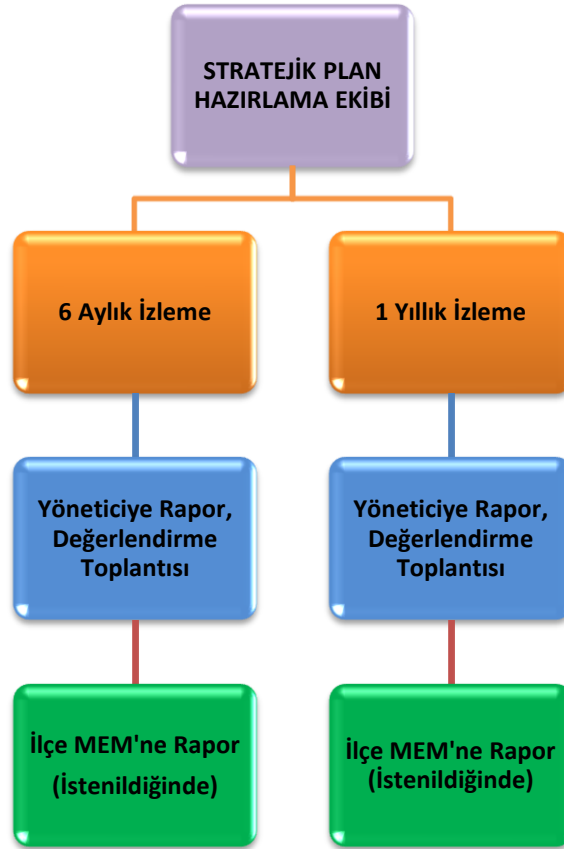
Şekil 3: İzleme ve Değerlendirme Süreci